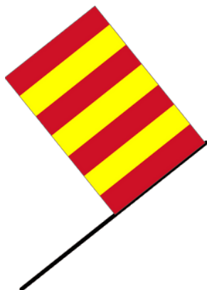
Ριγέ κόκκινη -κίτρινη σημαία

Σε περίπτωση παρατυπίας ο οδηγός αυτός αποβάλλεται από την εκδήλωση και δεν λαμβάνει πίσω το αντίτιμο συμμετοχής.